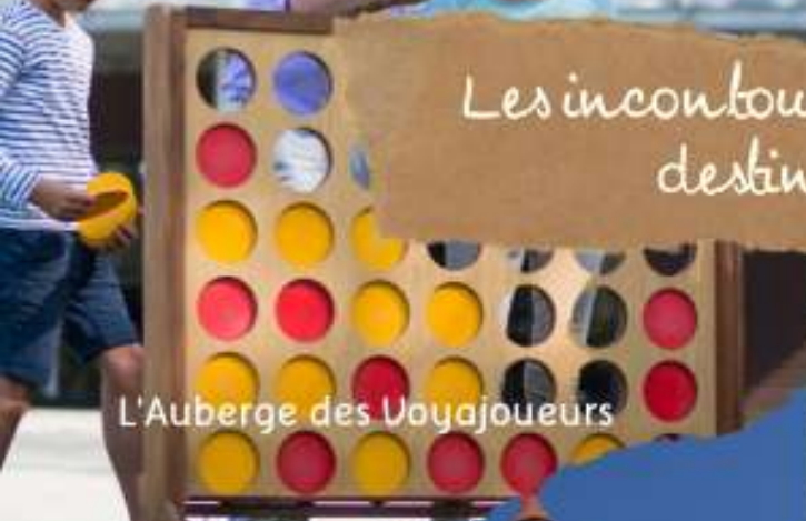
L'Auberge des Voyajoueurs