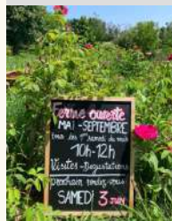
Lucette et camomilles

Tél. : 06 79 58 69 80 lucette.camomille@gmail.com