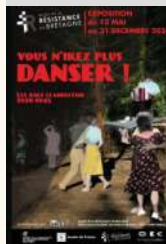
Musée de la Résistance