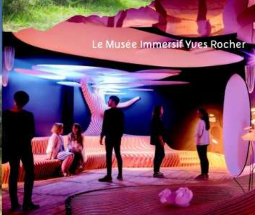
Le Musée Immersif Yves Rocher