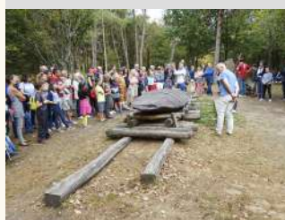
Menhirs de Monteneuf